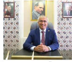
MUSTAFA GÜLER TAVŞANLI BELEDİYE BAŞKANI