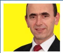
HALİL BAŞER ÇAVDARHİSAR BELEDİYE BAŞKANI