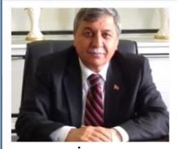
ARİF TEKE ALTINTAŞ BELEDİYE BAŞKANI