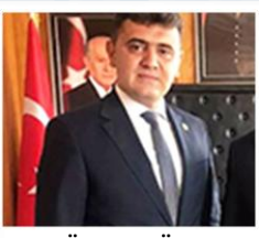
GÖKHAN GÜREL ASLANAPA BELEDİYE BAŞKANI