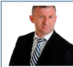
MUSTAFA DÜZGÜN TUNÇBİLEK BELEDİYE BAŞKANI