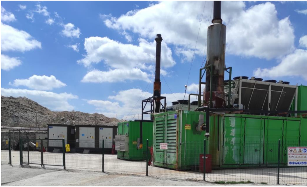
Resim 15. LFG Elektrik Enerjisi Üretim Tesis

2023 yılında metan gazından elde edilen elektrik ile 5.750 hanenin elektrik ihtiyacını karşılayacak kadar elektrik üretimi yapılmıştır.