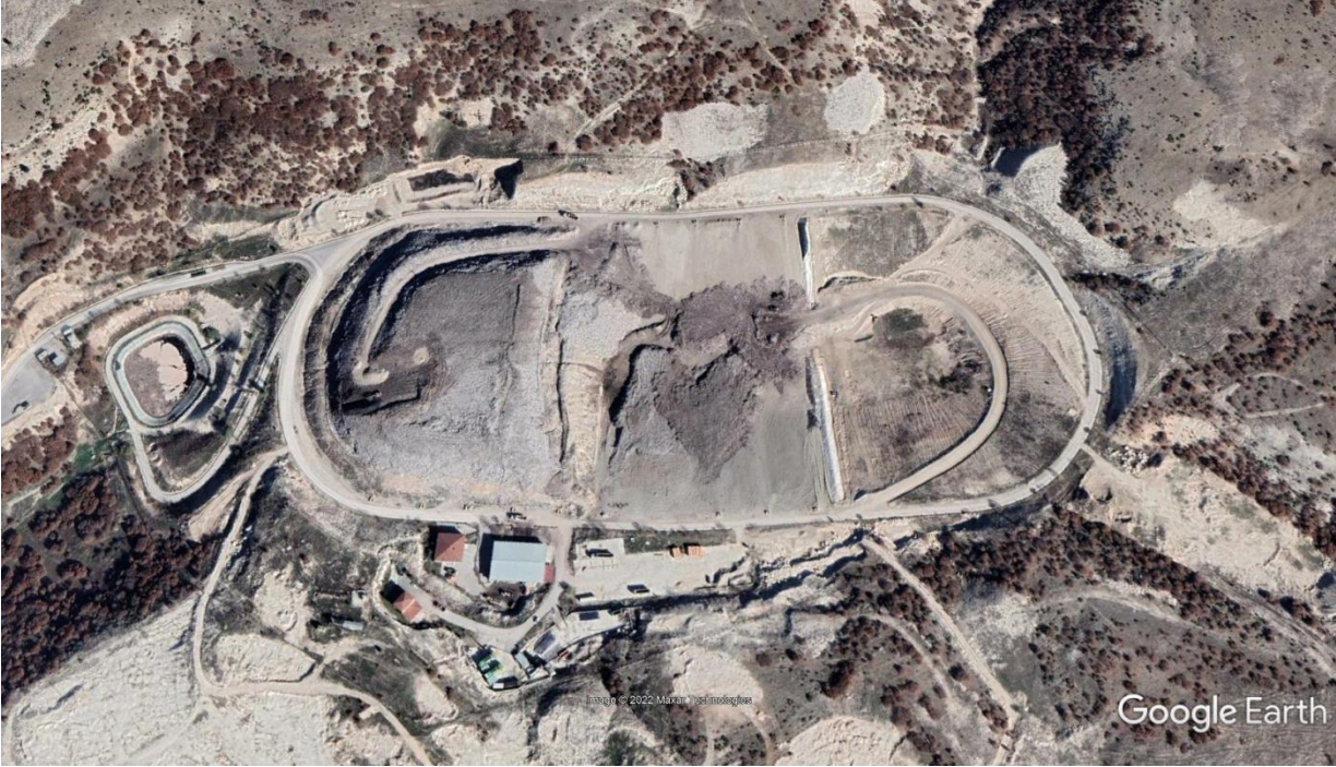
Resim 2. II. Sınıf Düzenli Depolama Sahası Genel Görünümü

Makine Park Alanı, Atölye ve Depo: Garaj, 12 (on iki) adet depolama ekipmanının parkı için uygun olacak şekilde 25*38 (yirmi beş çarpı otuz sekiz) yaklaşık 957 (dokuz yüz elli yedi) m 2 , boyutlarında koruyucu bir çatı örtüsü olan ve kenar duvarı olmayan bir yapı olarak inşa edilmiştir. Atölye ve depo ekipmanı tamir ve bakımı, yedek parça ve materyallerin depolanması için inşa edilmiş olup, yaklaşık 150 (yüz elli) m 2 olarak garaj alanından kullanılmıştır.