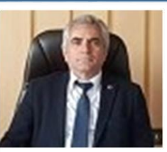
ŞEMSETTİN AKAĞAÇ DUMLUPINAR BELEDİYE BAŞKANI