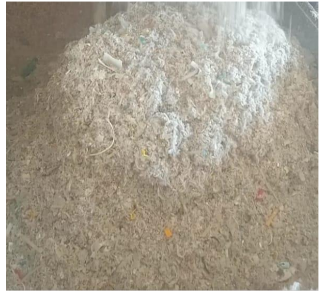
Resim 18. 150 Derecede Sterilize Edilmiş Tıbbi Atığın Son Hali