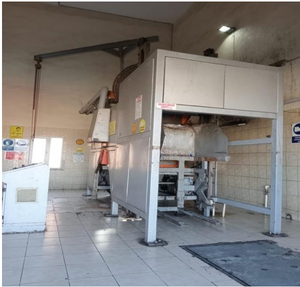
Resim 17. Tıbbi Atık Sterilizasyon Ünitesi