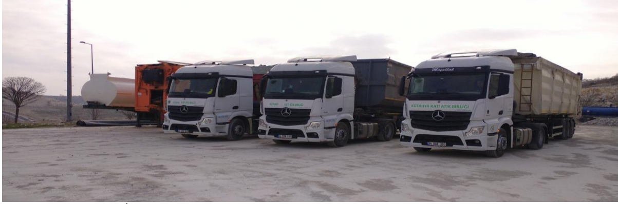
Resim 11. Transfer İstasyonlarından Düzenli Depolama Tesisine Atık Getiren Araçlar

2023 yılında Birlik üyelerimizden gelen, 2. Sınıf Düzenli Depolama Sahamızda depolanan evsel atık miktarlarını gösterir tablo aşağıda sunulmuştur.