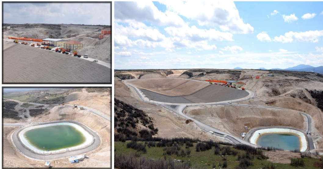
Resim 1. Düzenli Depolama Sahası

Düzenli depolama sahamıza ait görseller Resim 1 'de verilmiştir.