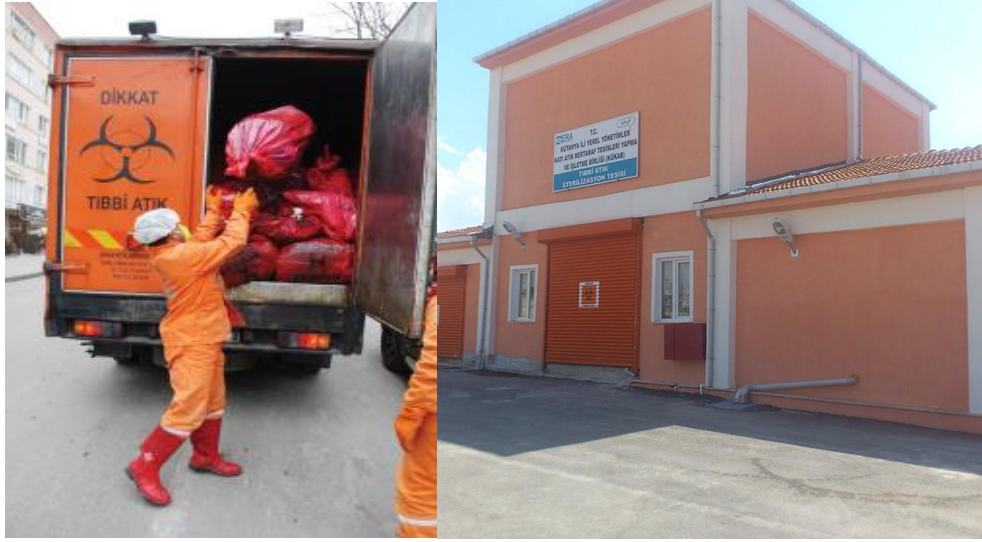
Resim 16. Tıbbi Atık Toplama Faaliyeti

İlimizde toplanarak bertaraf edilen tıbbi atıklarda bir önceki yıla göre % 10 oranında azalış olduğu ve bu durumun nedeninin dünya genelinde yaşanan pandemi sürecinden kaynaklanan tıbbi atıkların 2023 yılında önceki iki yıla göre pandemi etkisinin azaldığı ve dolayısıyla tıbbi atık miktarında da azalma olduğu görülmektedir.